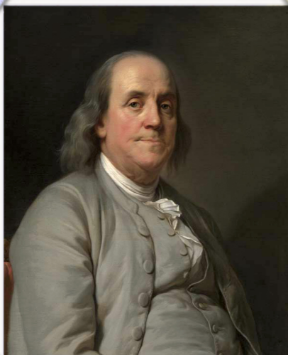
Portrait de Benjamin Franklin.

Source : « Réflexions de Vergennes », in L'indépendance américaine 1763-1789, André Kaspi, éd Gallimard, Paris, 1976 ( ici )