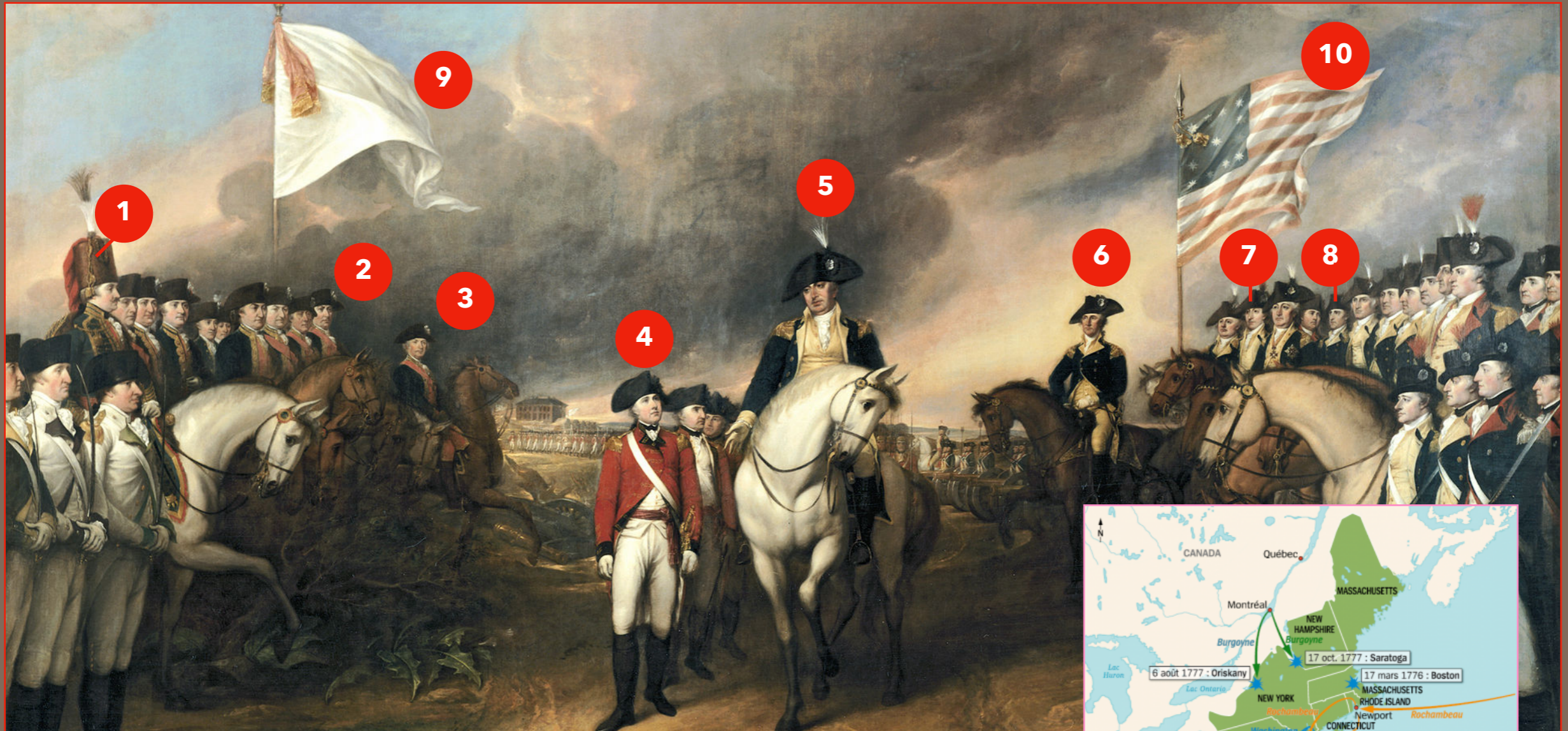
Reddition de Lord Cornwallis à Yorktown, 1781 (John Trumbull, 1817)