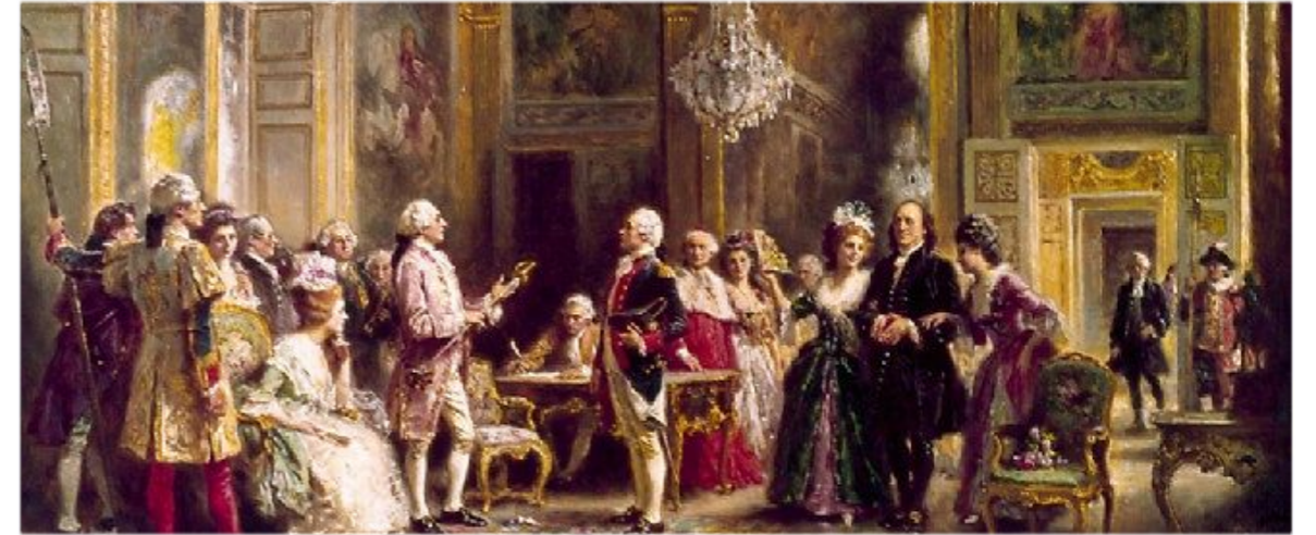
20 mars 1778, Louis XVI reçoit Benjamin Franklin et soutient les États-Unis.