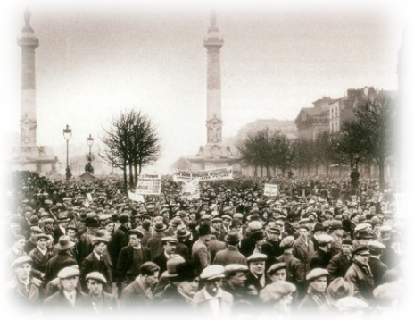
Place de la Nation, le 12 Février 1934